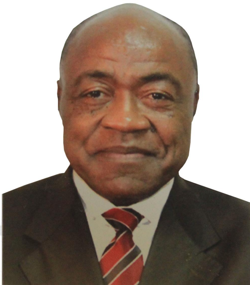
BIDOUNG MKPATT Ministre des Sports et de l'Education Physique Minister of Sports and Physical Education