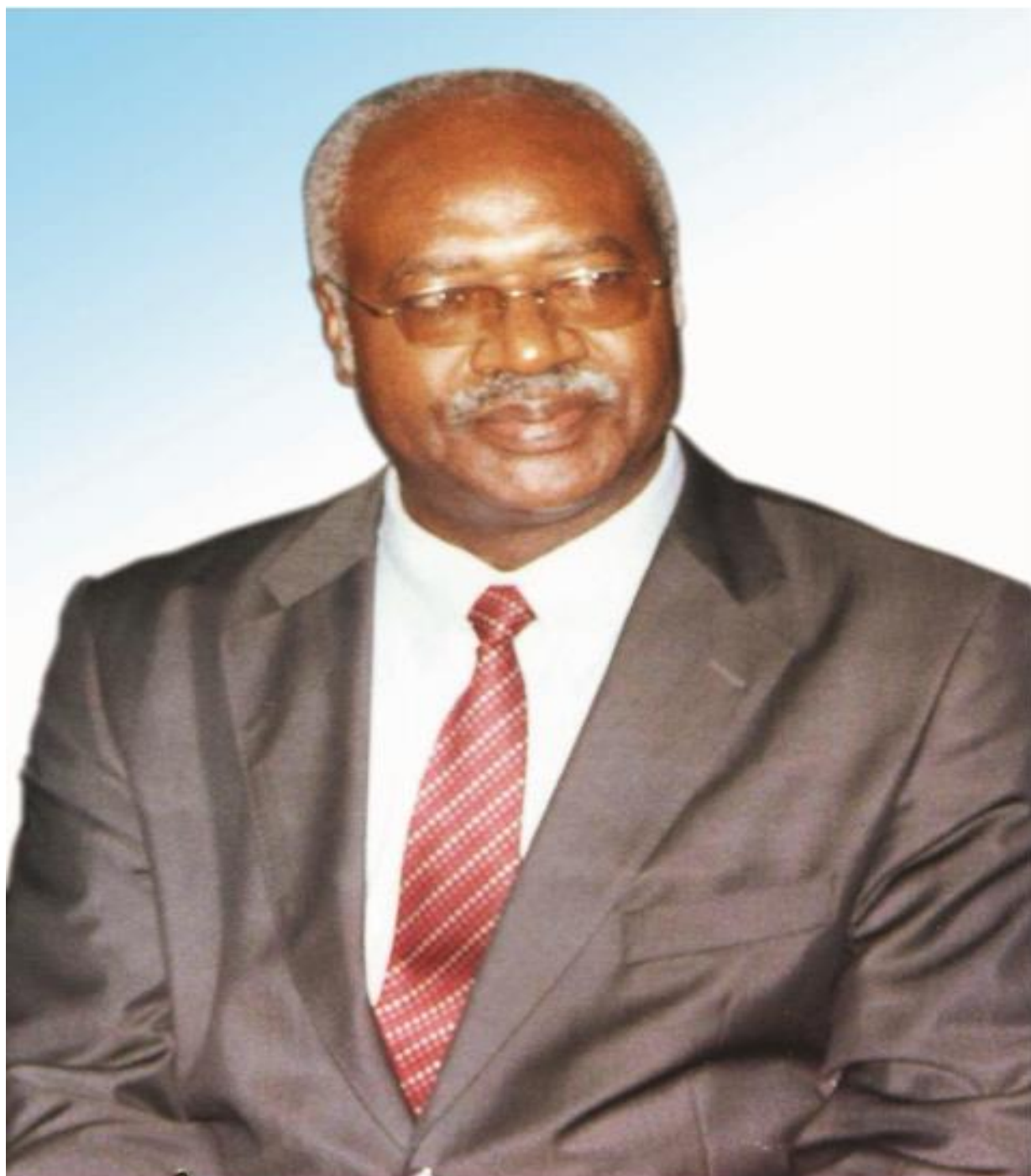
S.E. Philémon YANG Premier Ministre, Chef du Gouvernement Prime Minister, Head of Government