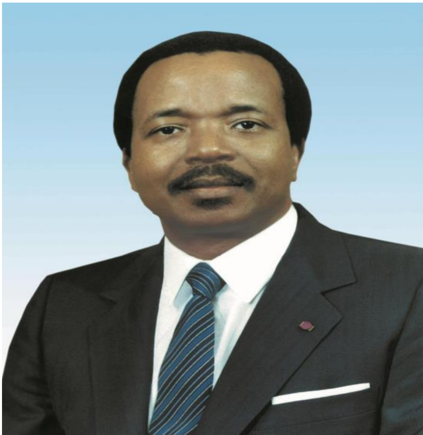
S.E. Paul BIYA Président de la République du Cameroun H.E. Paul BIYA President of the Republic of Cameroon